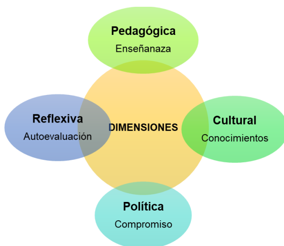
Figura 2 Dimensiones para el desarrollo de competencias

En el siguiente esquema se puede evidenciar la relación que existe entre las dimensiones, es decir, estas dimensiones están interrelacionadas y no se pueden medir de manera aislada. En este sentido, en la dimensión pedagógica se valora forma de enseñanza del docente, esto es, metodologías, estrategias y motivaciones. En la dimensión cultural, se mide la amplitud de los conocimientos del docente, es decir, para que este pueda brindar una enseñanza de calidad, también necesita de una amplia gama de conocimientos. La dimensión política refleja el compromiso del docente para con su labor. Y la dimensión reflexiva tiene que ver con la autoevaluación de su propia labor.